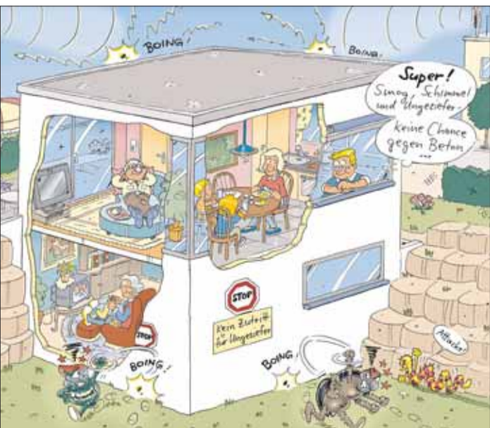
Ein Massivhaus bietet Schutz vor Schimmel und Schädlingen. Auch Smog muss draußen bleiben. Da kann man ganz entspannt gemeinsam essen, ein Nickerchen machen oder sich im Lieblingssessel ausruhen.